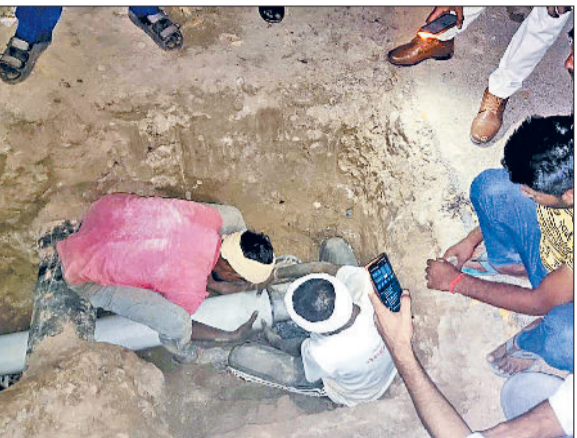
फतेहाबाद। हंस कालोनी में पाइप डालने के काम में जुटे कर्मचारी।