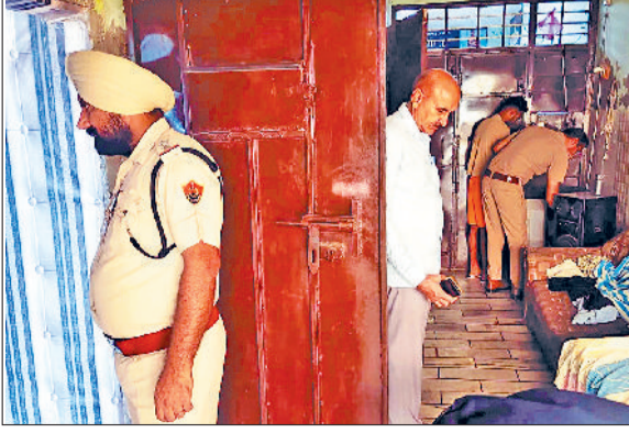
रतिया। तलाशी अभियान चलाते पुलिस कर्मचारी।

अभियान के दौरान पुलिस ने रतिया शहर की गलियों, प्रमुख बाजारों, ढाबों, बस अड्डों तथा आसपास के गांवों में दबिश दी। इस दौरान अनेक वाहनों और व्यक्तियों की गहन जांच की गई। कुछ स्थानों