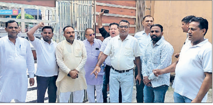
टोहाना। नगरपरिषद गेट पर ताला जड़कर प्रदर्शन करते प्रधान व पार्षद।