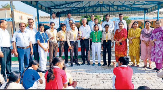
भूना। गोरखपुर में विजेता खिलाड़ियों को सम्मानित करते हुए प्राचार्य।