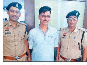
सिरसा। फर्जी डिग्री का आरोपी पुलिस की गिरफ्तार में।