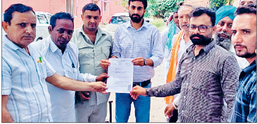
सिरसा। अधीक्षक अभियंता को ज्ञापन सौंपते कर्मचारी।