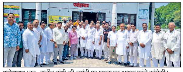
फतेहाबाद। स्व. राजीव गांधी की जयंती पर अपना घर आश्रम पहुंचे कांग्रेसी।

पूर्व प्रधानमंत्री स्वर्गीय राजीव गांधी की 81वीं जयंती को जिला कांग्रेस कमिटी ने सेवा दिवस के रूप में मनाया। हांसपुर रोड पर स्थित श्री कृष्ण प्रणामी सदरू कुपा अपना घर आश्रम में महिला आश्रम में कांग्रेसी कार्यकर्ताओं ने जरूरतमंद लोगों, महिलाओं की अल्पाहार से सेवा की, वहीं श्रीकृष्ण प्रणामी